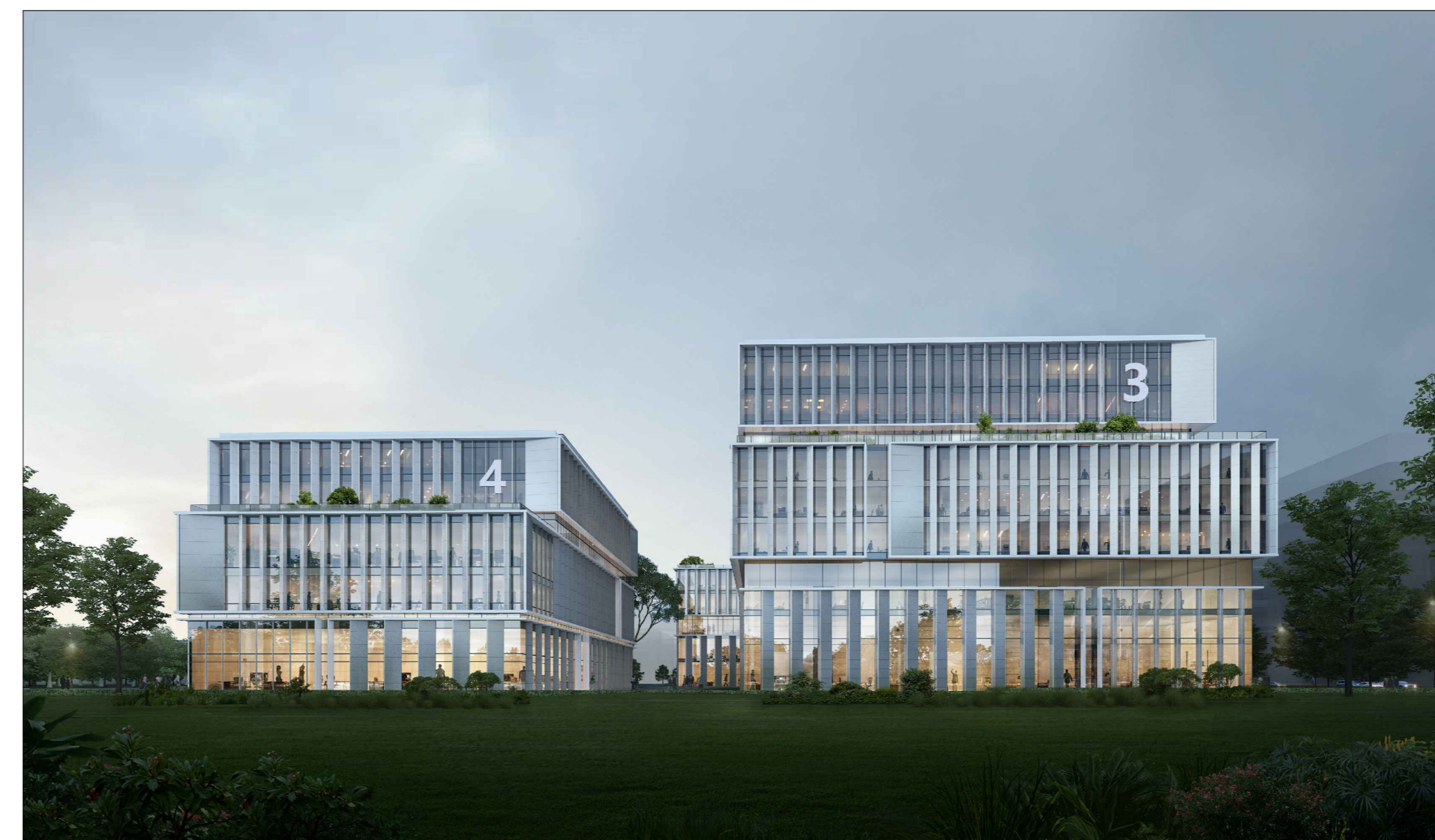
单体效果图（仅为示意）