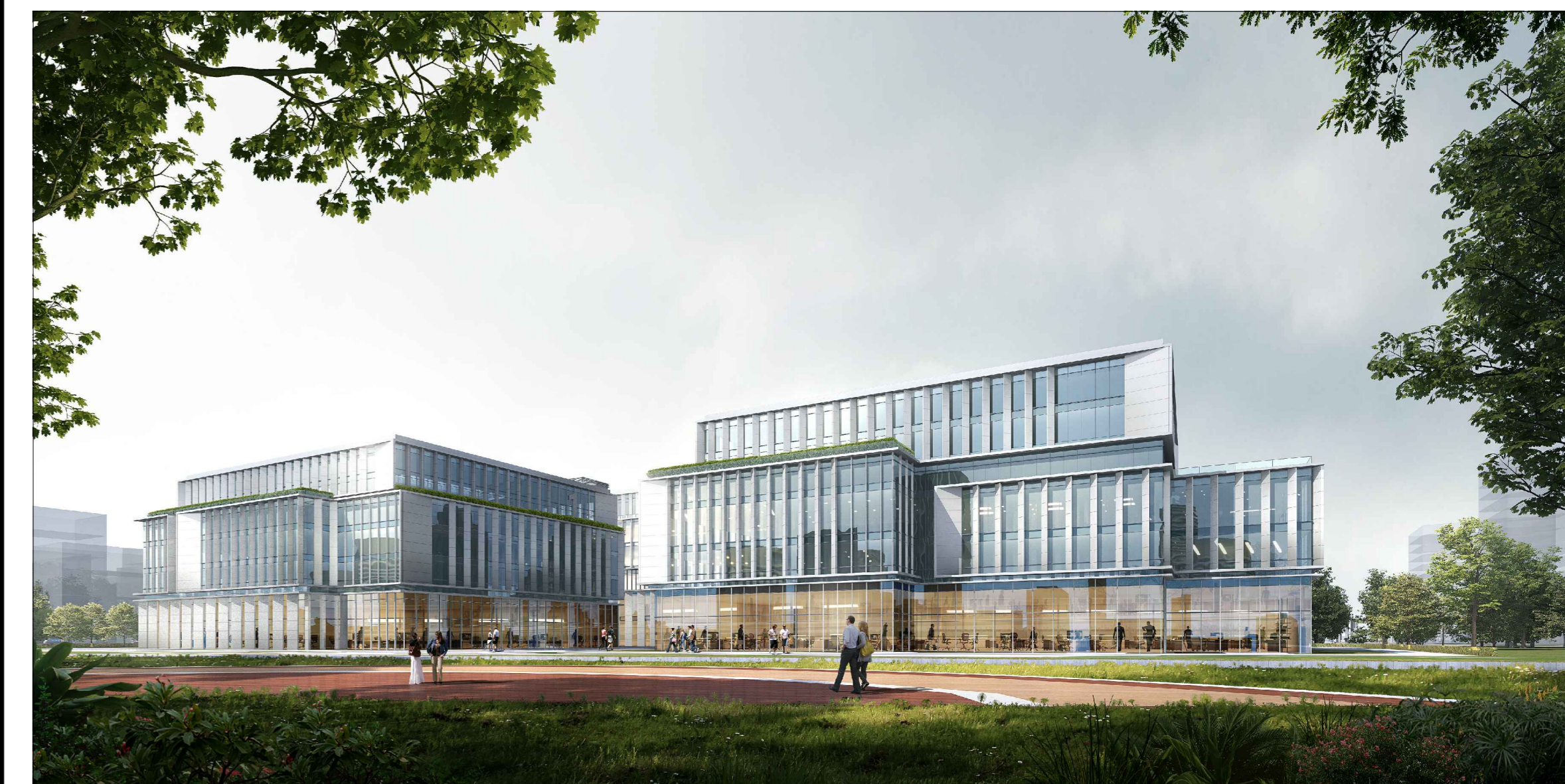
单体效果图（仅为示意）