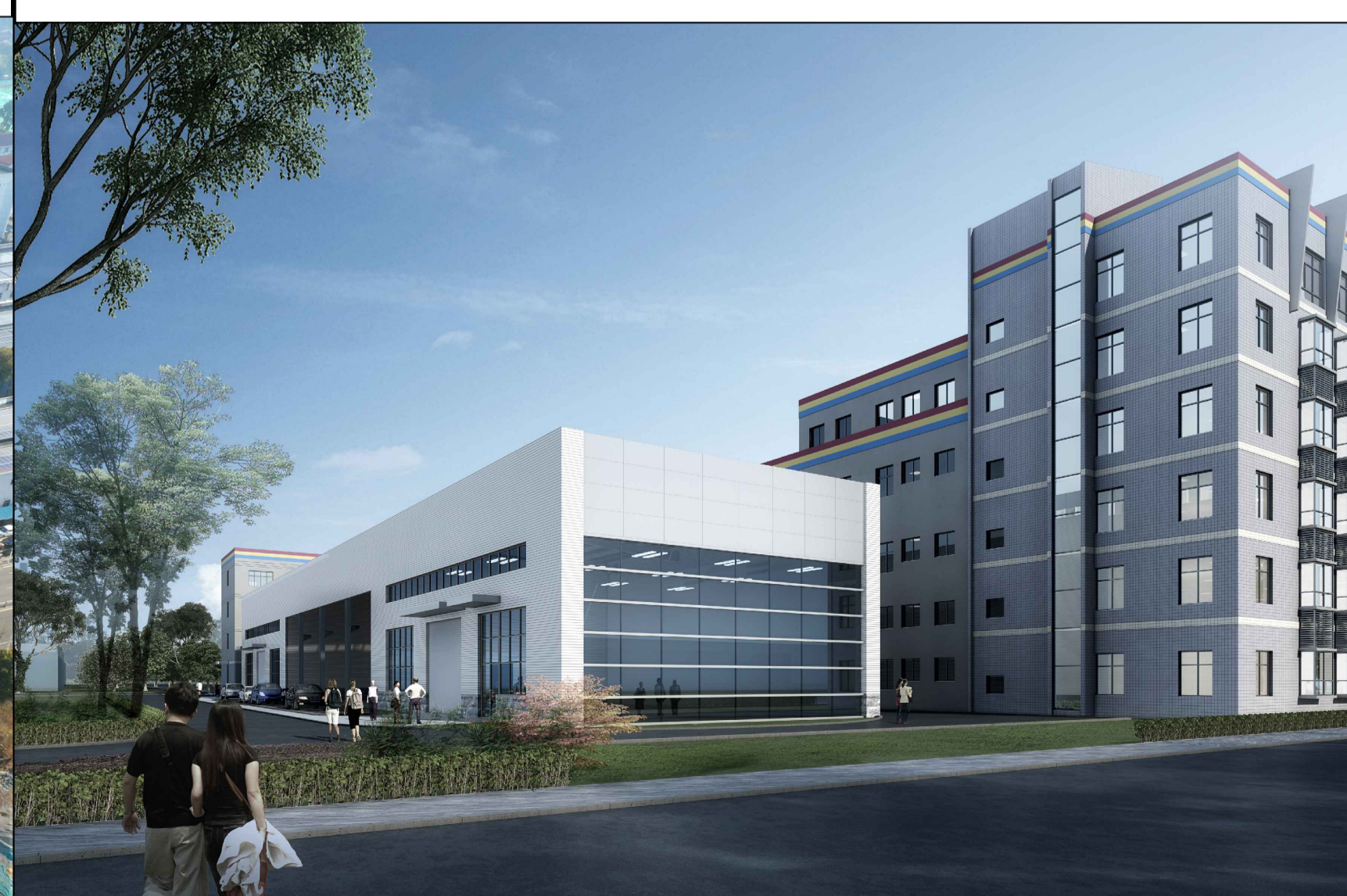
单体效果图（仅为示意）