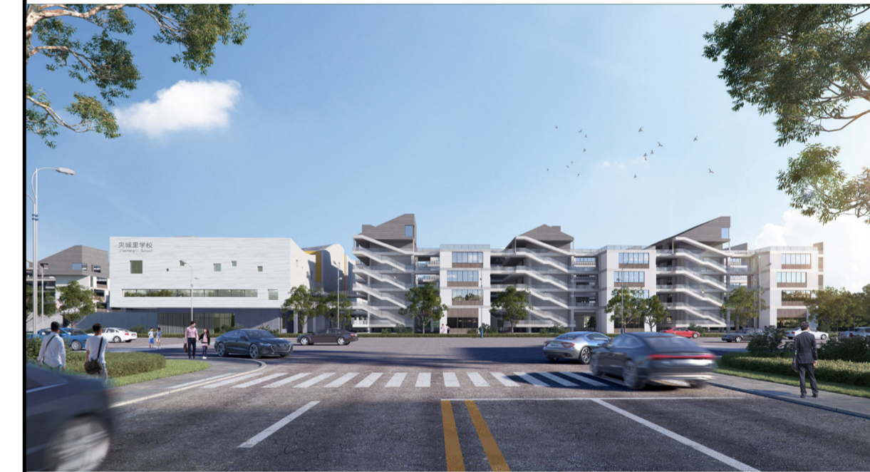
单体效果图（仅为示意）