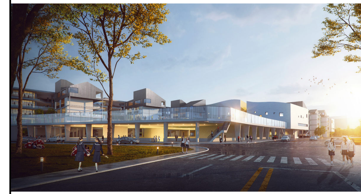
单体效果图（仅为示意）