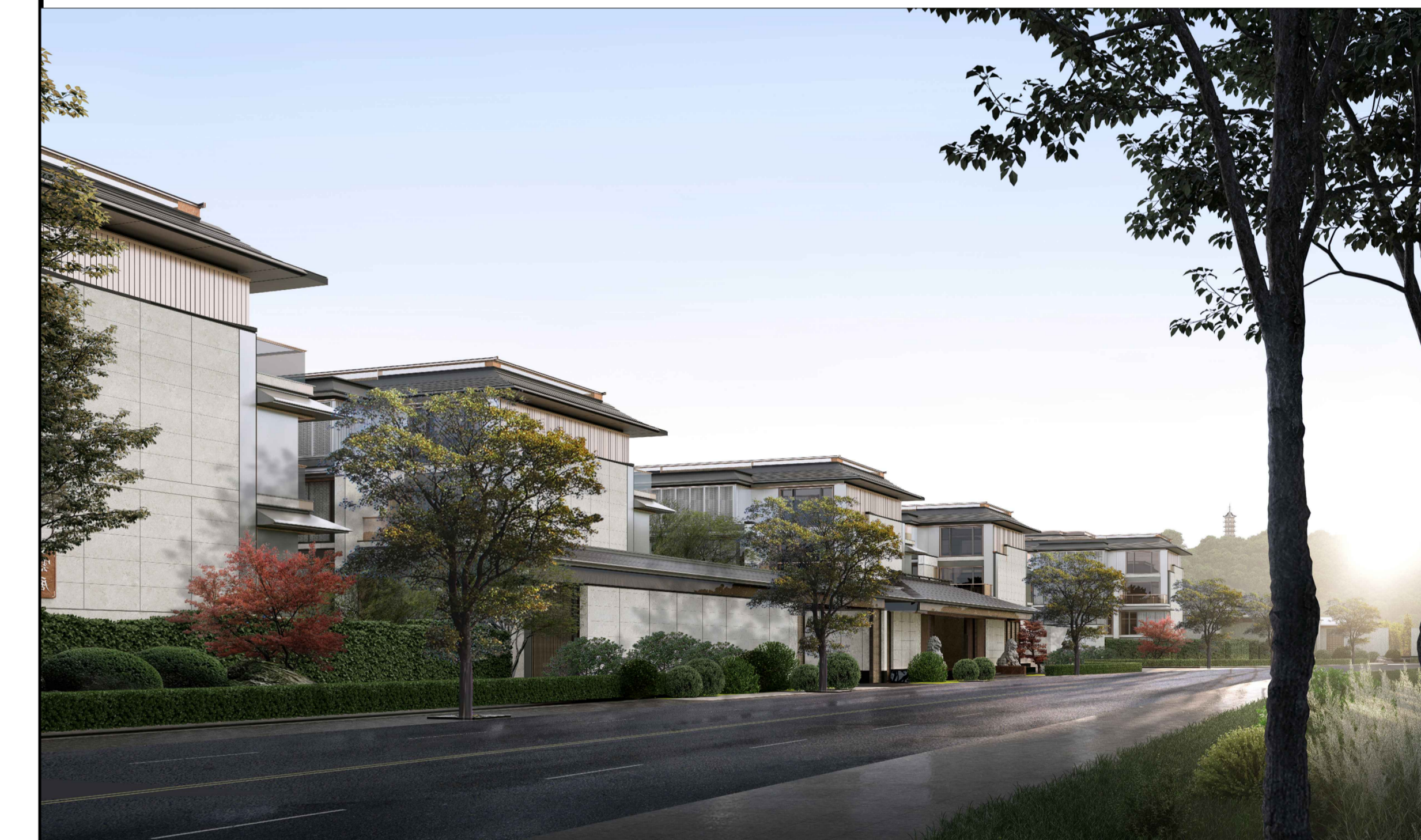
单体效果图 (仅为示意)