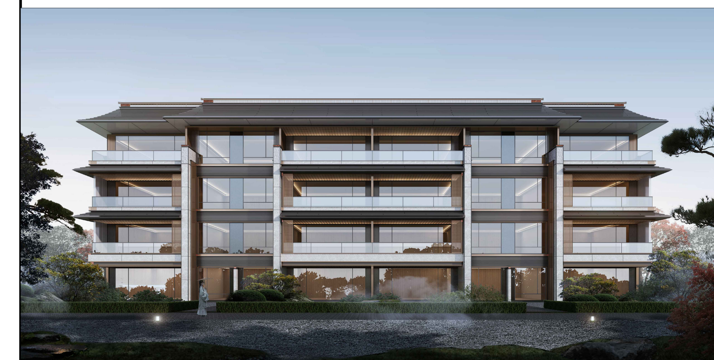
单体效果图 (仅为示意)

根据城乡规划管理有关规定，现对无锡惠云置业有限公司XDG-2023-39号地块建设项目规划设计方案进行批前公示。