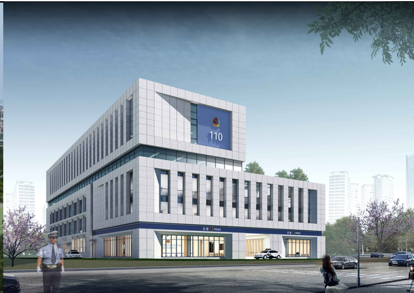
单体效果图（仅为示意）