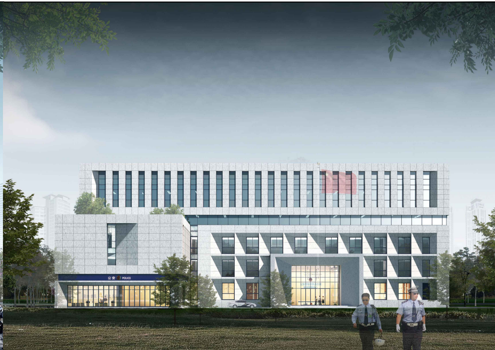
单体效果图（仅为示意）